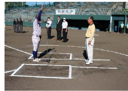
来賓・元プロ野球選手、野球評論家の広澤克実氏をお招きしました。

当金庫は、これまでSDGs精神に則りユネスコスクールの承認を受け「持続可能な開発のための教育(E SD)」を積極的に推進しています。