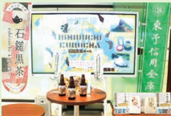
石鎚黒茶クラフトビール

当金庫と地域の皆様、全国の信用金庫が主導している「よい仕事おこしフェア実行委員会」の連携で当地の魅力を発信しています!!