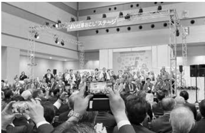
2024年よい仕事おこしフェア (令和6年12月3日~4日)