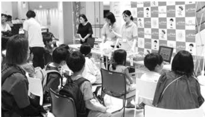
お仕事体験フェス (令和6年9月21日~23日)