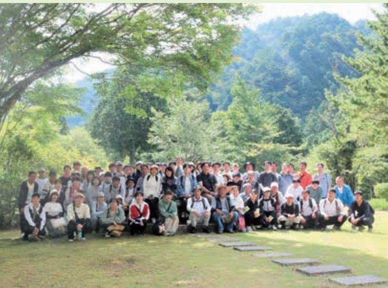
全体会「フォレスターハウス(住友の植林事業ゆかりの地)・散策」 (令和6年8月3日)