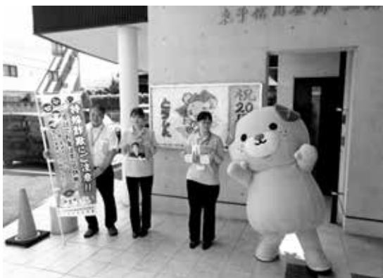
特殊詐欺未然防止キャンペーン (令和6年8月13日~16日)