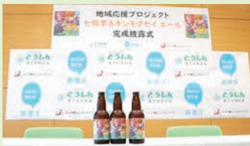
七福芋クラフトビール