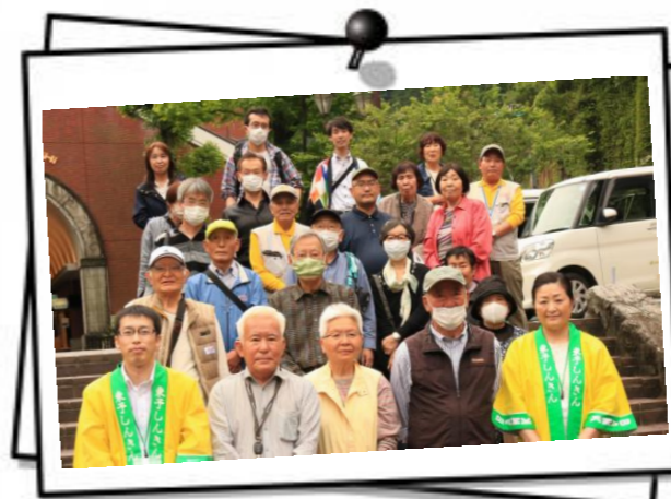
(マイントピア別子にて参加されたお客様との集合写真)

当金庫は、新居浜市、JR 四国と連携し地域固有の資源を観光コンテンツとして楽しんでいただくツアーを開催し、合計36名の方が参加されました。地域のおもてなしも盛りだくさんで、参加者様より「新居浜の魅力が凝縮されていて勉強になった」「ガイドさんの解説が丁寧で良かった」等のお声もいただき大成功で終えることが出来ました。