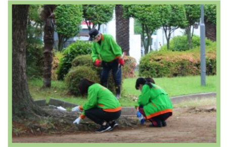
(草を引いているところ)