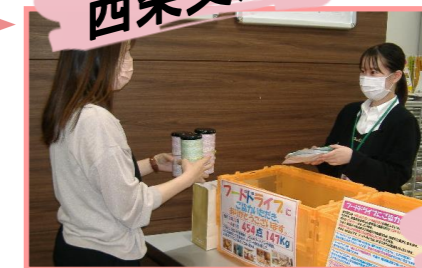
(お客様から食料品をお預かりしているところ)