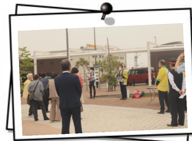
(新居浜市原副市長挨拶の様子)