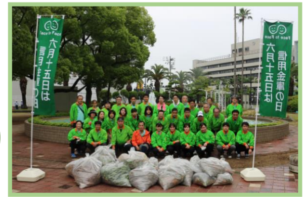
(集めたゴミを前に記念撮影)

信用金庫では、昭和26年6月15日に「信用金庫法」が公布・施行されたことになみ、6月15日を「信用金庫の日」と定めています。当金庫では、地域貢献活動の一環として令和4年6月11日(土)に「感謝の気持ち」を込めて、全店役職員が各営業地区で清掃活動を実施しました。この活動は、愛媛新聞にも取り上げていただきました。今後も地域社会の一員として、地域に根ざした活動を実施します。