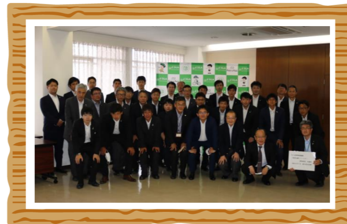
(独立行政法人中小企業基盤整備機構の講師の方々と職員)

地域経済の持続的発展を目的に渉外係18名が独立行政法人中小企業基盤整備機構様指導のもと「事業承継アドバイザー」の資格取得に取り組みます。