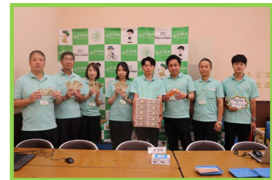
《イベントに参加した職員》

令和7年9月13日（土）~14日（日）の2日間、イオンモール新居浜にて「東予おしごと体験フェス」が開催され、当金庫も出展いたしました。フェスではJ-FLEC(金融経済教育推進機構)講師にもご協力いただき、金融教室やオリジナル貯金箱づくりを実施しました。当金庫のフェスに来てくださった皆様、ありがとうございました！