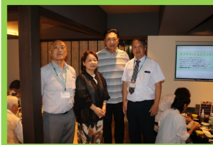
<<元大関霧島関と記念撮影！>>

★「とうしん年金友の会」とは★ 当金庫で公的年金をお受け取りいただいているお客様を対象に、豊かな生活や福利厚生を充実を事業目的とするサークルです。 優遇定期預金、お誕生日のプレゼント、旅行のご案内、団体傷害保険制度のご案内、年金宅配サービスの特典があります！