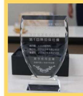
《青野海運株式会社様》