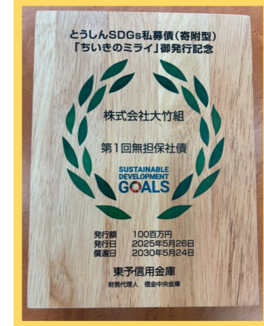
《株式会社大竹組様》