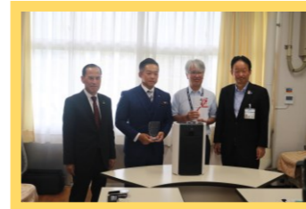
《贈呈式の様子（新居浜市立中萩中学校）》