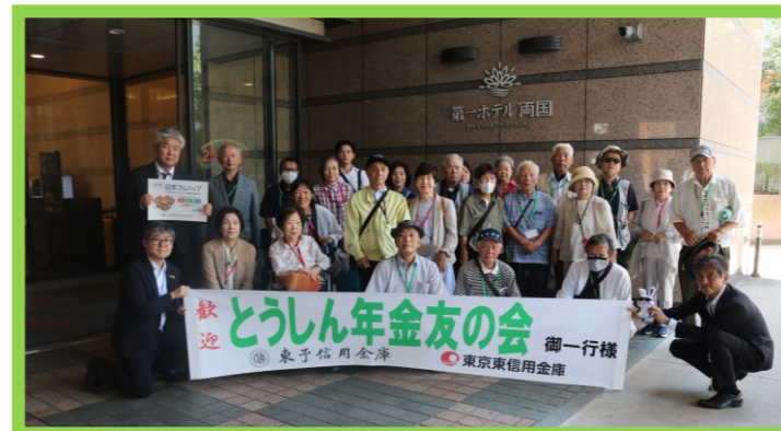
<<東京東信用金庫の職員様にお出迎えいただきました！>>