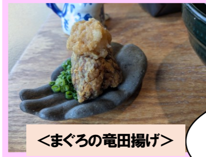
<まぐろの竜田揚げ>