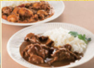
仙台 利久 牛たんカレー2種セット