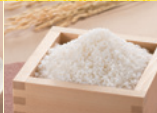
秋田県産 あきたこまち