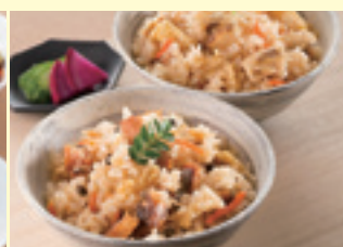
愛媛海産 瀬戸内 漁師めしの素詰合せ