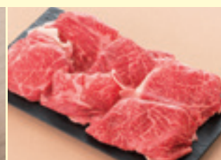
熊本・産山村 阿蘇の草し あか牛 切落し