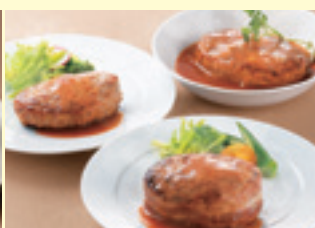
神戸 ハング こだわりのハンバーグ三味