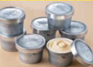
十勝ドルチェ プレミアムアイス

キャンペーン期間中、上記の対象商品をお申し込みの方の中から抽選で1,500名様に全国津々浦々、四季折々の魅力ある10種類の賞品のうち、いずれかをプレゼント! ※賞品の選択はできません。