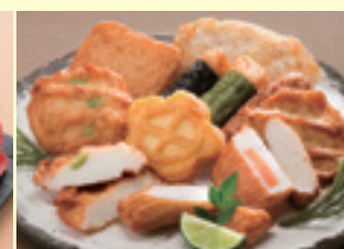
鹿児島 有村屋 ざつまあげ