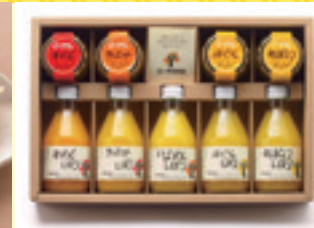
和歌山 伊藤農園 100%ピュアジュース&ジュレセット