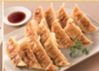
宇都宮餃子館 餃子詰合せ